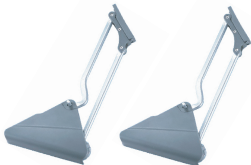
2x Parte principal superior derecha, inferior izquierda